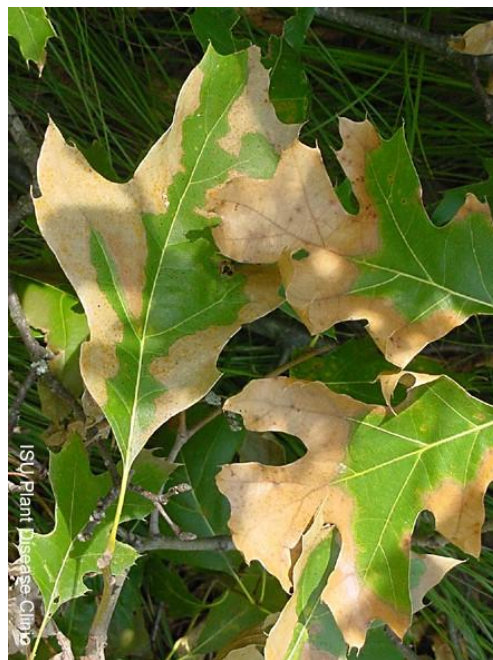
Figure 2. Bord distinct de feuilles infectées (Iowa State University).

Les champignons, qui forment des structures comprimées, sont composés de mycéliums foncés qui peuvent être logés sous l'écorce des arbres infectés (figure 3). Il arrive parfois que ces structures comprimées provoquent la fissuration de l'écorce (figure 4) et dégagent une odeur semblable à celle de la gomme « Juicy Fruit ».