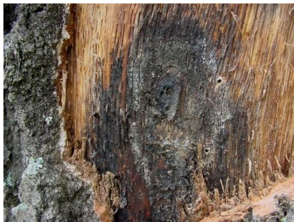
Figure 3. Champignon formant une structure comprimée sous l'écorce (Iowa State University).

Les champignons, qui forment des structures comprimées, sont composés de mycéliums foncés qui peuvent être logés sous l'écorce des arbres infectés (figure 3). Il arrive parfois que ces structures comprimées provoquent la fissuration de l'écorce (figure 4) et dégagent une odeur semblable à celle de la gomme « Juicy Fruit ».