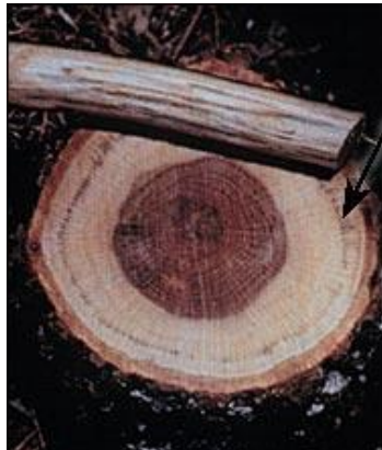
Figure 6. Tache noire – coupe transversale.