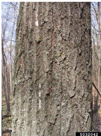
Figure 4. Fissures verticales dans l'écorce indiquant la présence d'une structure sporifère sous l'écorce.