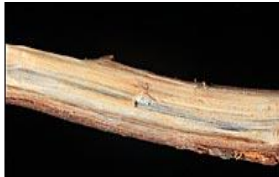
Figure 7. Tache noire longitudinale – coupe longitudinale.