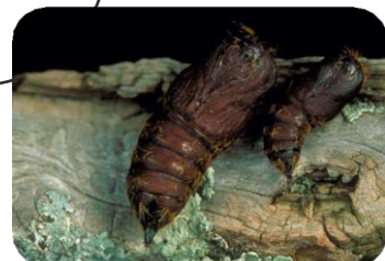
Juin - Juillet Pupes