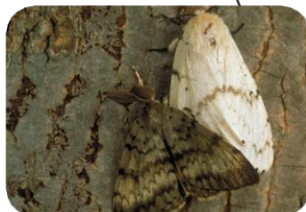
Juillet - Août Papillons adultes