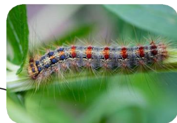
Avril - Juin Larves (chenilles)