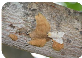
Juillet - Avril Œufs

Mâles adultes : gris brun avec marques sombres. Ils volent et survivent environ une semaine, s'accouplant avec différentes femelles.