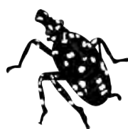
JEUNE LARVE AVRIL - JUIL