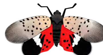
ADULTE JUIL - DÉC