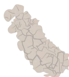
ŒUFS SEPT - AVRIL

Le fulgore tacheté (FT; Lycorma delicatula ) est un insecte envahissant en provenance d'Asie qui tue les plantes en se nourrissant de leur sève. Le FT se nourrit en essaims sur plus de 70 espèces d'arbres et de plantes telles que les vignes, les arbres fruitiers, le noyer noir, les érables et les chênes. Le FT est une menace pour la production canadienne de vin et de fruits et pour les milliards de dollars qu'elle génère.