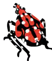
LARVE PLUS ÂGÉE JUIL - SEPT