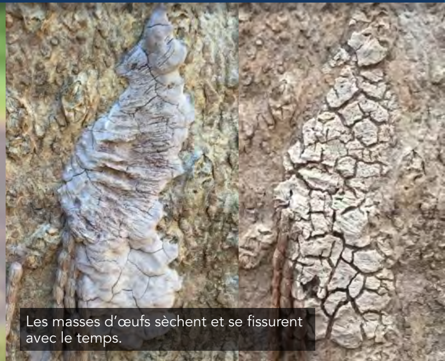
Les masses d'œufs sèchent et se fissurent avec le temps.

Le fulgore tacheté (FT; Lycorma delicatula ) est un insecte envahissant en provenance d'Asie qui tue les plantes en se nourrissant de leur sève. Le FT se nourrit en essaims sur plus de 70 espèces d'arbres et de plantes telles que les vignes, les arbres fruitiers, le noyer noir, les érables et les chênes. Le FT est une menace pour la production canadienne de vin et de fruits et pour les milliards de dollars qu'elle génère.